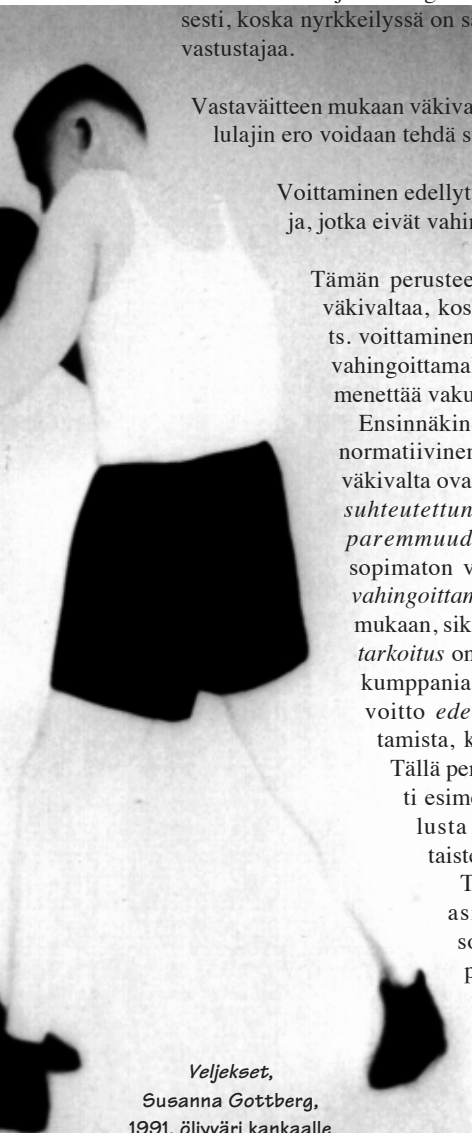
Veljekset, Susanna Gottberg, 1991, öljyväri kankaalle

Vapaan kilpailun oloissa sekä kilpailevia yrityksiä että ulkopuolisia vahingoittavat toimenpiteet ovat sallittuja.