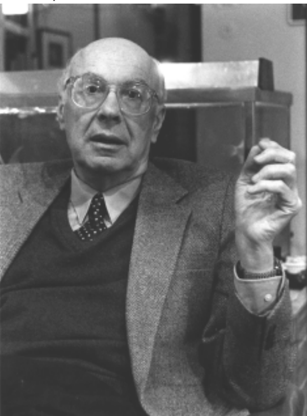
Matthew Lipman

Mutta on toki muunkinlaisia akateemisia filosofeja. Tunnen hyvin suurta sympatiata joitakin naisfilosofeja kohtaan, erityisesti Martha Nussbaumia. Hän tekee loistavaa työtä kriittikkona, analyttikkona jne. Meitä on moneksi. ■